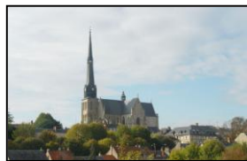
Vue de la ville

Il en existe deux sortes, le feuilleté et le fondant. L'origine du premier remonterait au XVIII ème siècle avec l'apparition de la pâte feuilletée mais le second est bien plus ancien. Au temps des gaulois, la ville était un carrefour commercial et c'est ainsi que serait née sa spécialité d'une rencontre entre la galette des Carnutes et les amandes amenées par les romains. Depuis le gâteau a traversé les époques et sa Confrérie organise chaque année le concours national du meilleur Pithiviers. La ville et ses proches environs présentent d'autres attraits touristiques :