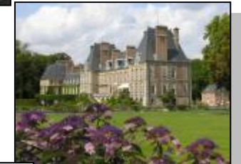
Château de Courances