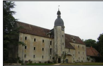
La grange aux dîmes

Grange aux Dîmes fin XIV ème , la maison dite de Chateaubriand, l'intérieur de son pigeonnier aux