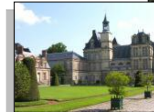
Château de Fontainebleau