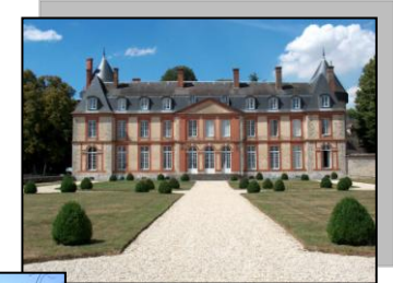
Château de Malesherbes