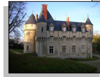
Château de Rouville